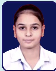
Venkateswara College Tamanna