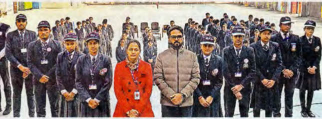
मदीना में स्थित आरकेपी स्कूल मदीना में एनएसएस कैम्प में गतिविधि करते विद्यार्थी।

संस, महम : मदीना के रामकृष्ण परमहंस वरिष्ठ माध्यमिक विद्यालय में एनएसएस कैम्प के छठे दिन स्वयंसेवकों ने दमकल विभाग के महत्व को जाना। टीम के सदस्यों ने आग फैलने से