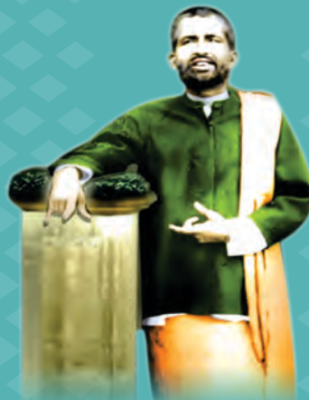
Swami Ramkrishan Paramhans (The Goal of Human Life is God's Realisation)