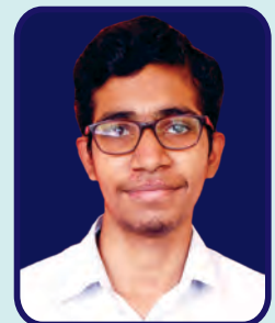
Shivaji College Vishwas