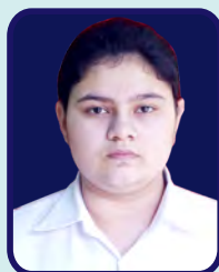
Kalindi College Garima