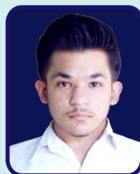
Shaheed Bhagat Singh College Himanshu