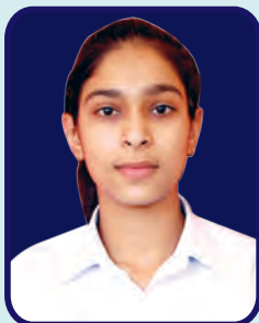
SGTB Khalsa College Aditi