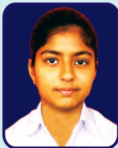
Miranda House Nikita