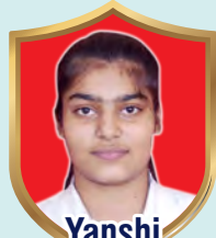
Yanshi Weightlifting Class 12