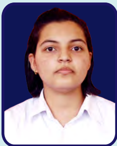
Hindu College Diksha