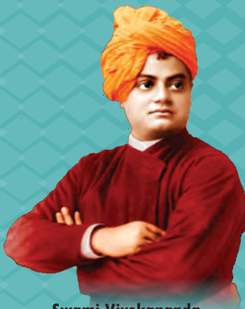
Swami Vivekananda (The Paramhans of Saint Ramkrishan)

From nature springs curiosity, curiosity causes exploration, and from exploration comes knowledge. Knowledge is the seed for creation and reation is the aspiration of all human endeavours. Knowledge never dies and nor can it be deformed. It is immortal and its quest is the true path for salvation.