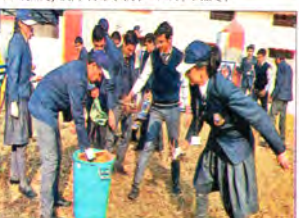
आरकेपी स्कूल, मदीना में स्वच्छता अभियान चलाने हुए स्वयंसेवक।