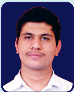
ARSD College Shubham