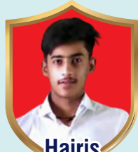
Hairis Shooting Class 10