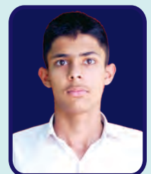
Ram Lal Ananda College Shekhar