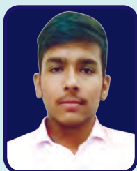
Satyawati College Harsh