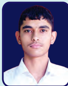
Kirori Mal College Nishant