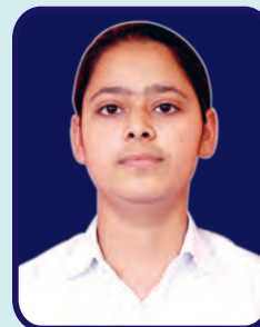
Deshbandhu College Nitika