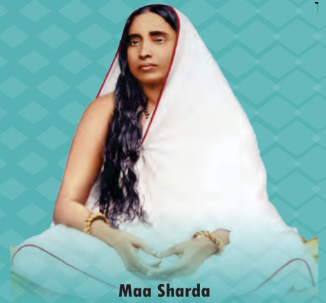
Maa Sharda All teachers are one. The same power of God works through them all